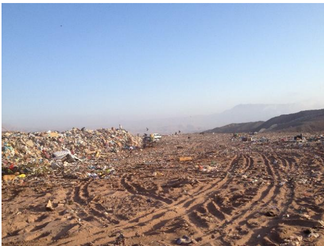
Ein kleiner Teil der Müllhalde

spanisches Memory. Der ungeahnte Höhepunkt des Tages entwickelte sich dann aber aus der geplanten Karaoke: Da es für die Kinder zu schwierig war, wie gedacht auf Deutsch zu singen, änderten wir das Programm ein bisschen ab und tanzten mit den Kindern zum „Fliegerlied“. Zu sehen, wie sich die Kinder den ganzen Tag über gefreut haben, machte diesen Tag für mich bis jetzt auf jeden Fall zu einem der schönsten!