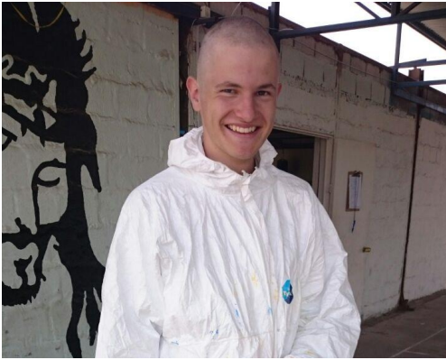
Ein Bild bei der Arbeitsstelle -mit frisch geschnittenen Haaren

der Nachbarstadt Alto Hospicio im Centro Comunitario El Rubio , einem Zentrum für Kinder. Dort können die Kinder, welche meist aus sozialschwachen Familien sind, am Nachmittag nach der Schule hinkommen und die Zeit bis zum Abend verbringen. Die Idee des Zentrums ist, den Kindern einen geschützten Rahmen zu bieten, in dem sie nicht mit Drogen, Gewalt oder ähnlichem in Berührung kommen.